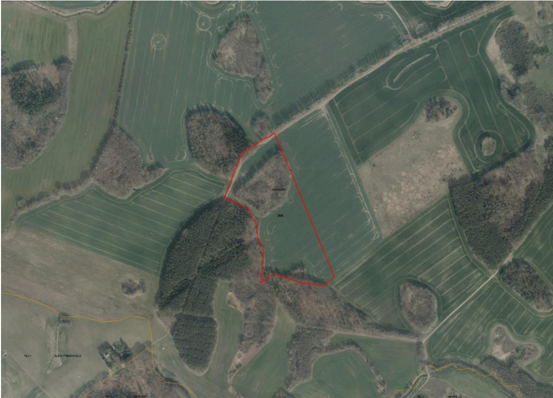
Gemarkungsgrenzen Basis: © Ämter für Geoinformation und Vermessung der Länder Mecklenburg-Vorpommern, Niedersachsen, Brandenburg, Berlin, Sachsen-Anhalt, Sachsen, Thüringen; Geobasisdaten © Geobasis-DE / BKG (2021). Nutzungsbedingungen: http://sg.geodatenzentrum.de/web_public/nutzungsbedingungen.pdf , Lageskizze