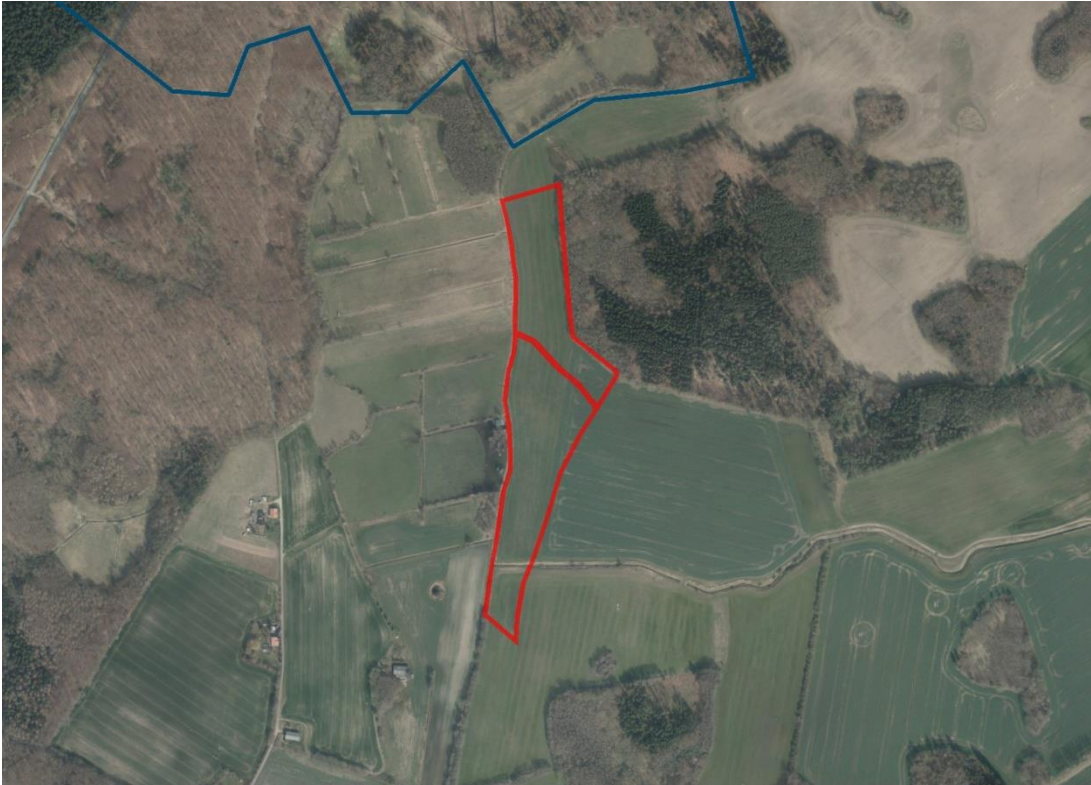
Geobasisdaten: © GeoBasis-DE / BKG (2021). Nutzungsbedingungen: http://sg.geodatenzentrum.de/web_public/nutzungsbedingungen.pdf . © GeoBasis-DE / BKG 2018 (Daten verändert), www.bkg.bund.de . Lageskizze