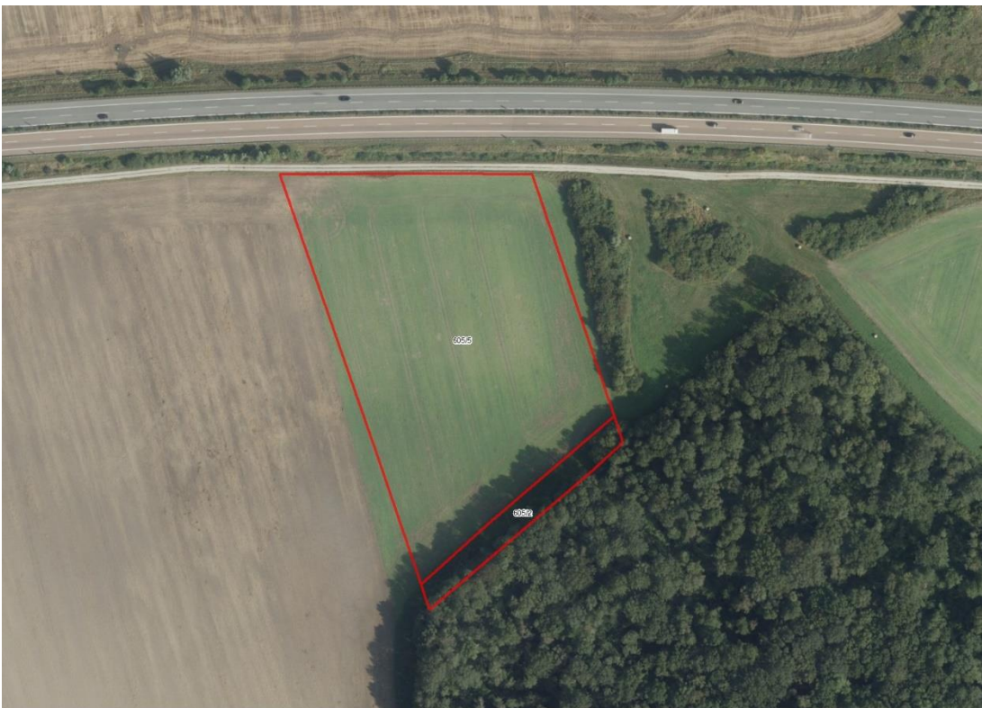
GIS Luftbild 1

Geobasisdaten: © GeoBasis-DE / BKG (2022), Nutzungsbedingungen: http://sg.geodatenzentrum.de/web_public/nutzungsbedingungen.pdf , © GeoBasis-DE / BKG 2018 (Daten verändert), www.bkg.bund.de , Lageskizze