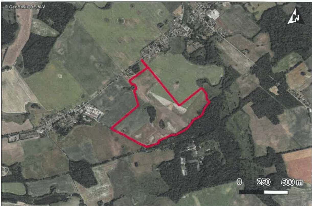
Abbildung 1 Lage des Geltungsbereichs des BP Nr. 29 „Photovoltaikanlage Reppelin/Wendfeld“

Die Lage ist in Abbildung 1 dargestellt. Die Gesamtfläche beträgt 39,8 ha.