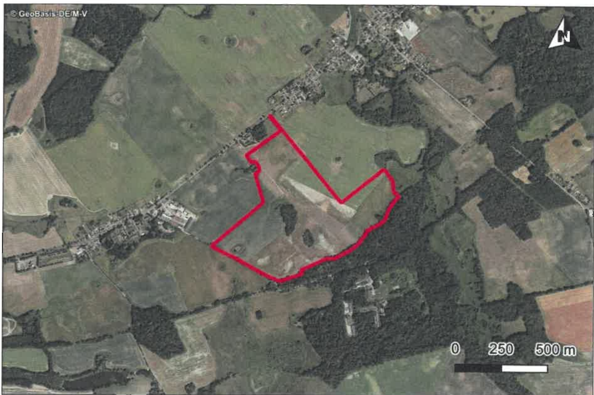
Abbildung 1 Lage des Geltungsbereichs des BP Nr. 29 „Photovoltaikanlage Reppelin/Wendfeld“

Die Lage ist in Abbildung 1 dargestellt. Die Gesamtfläche beträgt 39,8 ha.