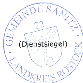
Enrico Bendlin Bürgermeister

Anlage: Übersichtskarte mit Darstellung des Geltungsbereiches