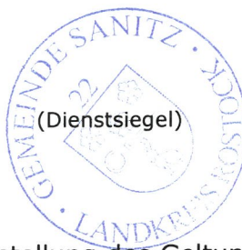
Enrico Bendlin Bürgermeister

Anlage: Übersichtskarte mit Darstellung des Geltungsbereiches