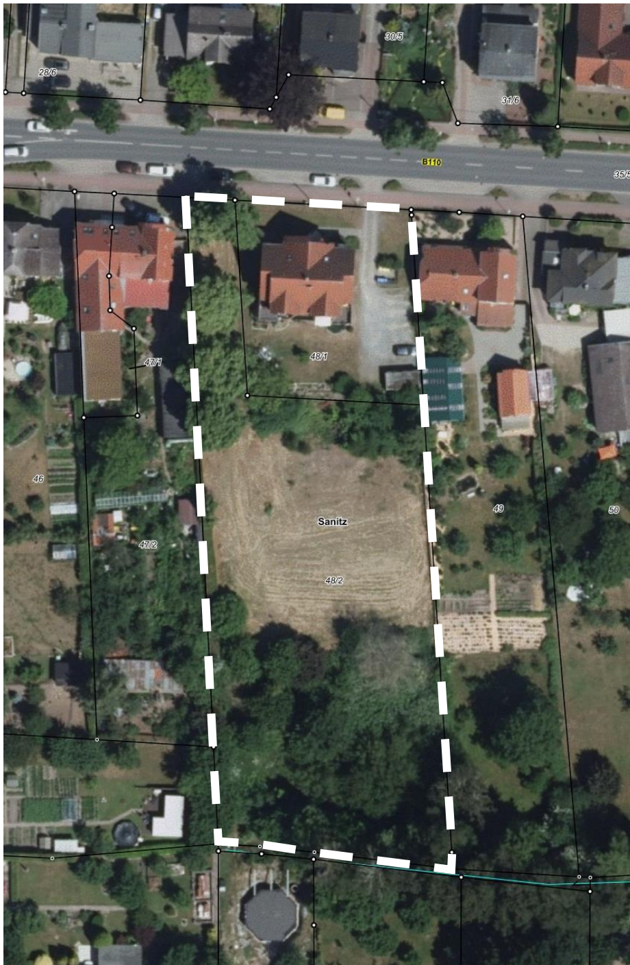
Luftbild: Quelle: gaia-mv.de April 2024, bearbeitet ign Melzer & Voigtländer Ingenieure PartG-mbB