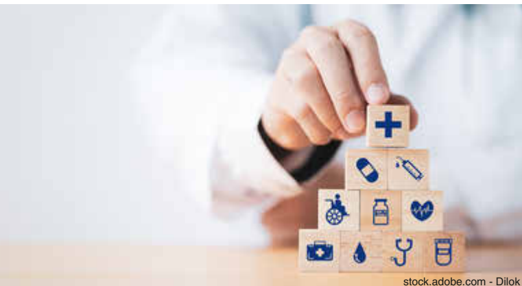
stock.adobe.com - Dilok