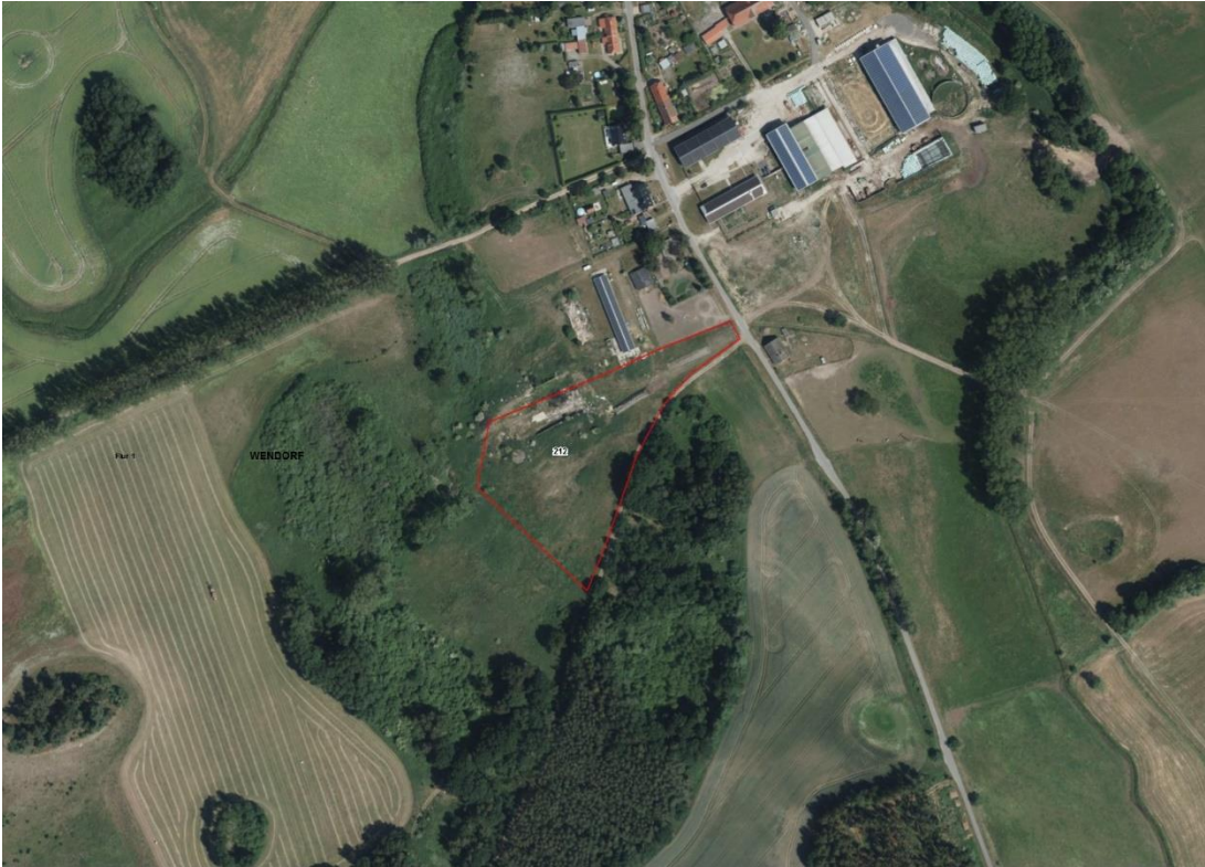
Gemarkungsgrenzen Basis: © Ämter für Geoinformation und Vermessung der Länder Mecklenburg-Vorpommern, Niedersachsen, Brandenburg, Berlin, Sachsen-Anhalt, Sachsen, Thüringen; Geobasisdaten: © GeoBasis-DE / BKG (2024). Nutzungsbedingungen: http://sg.geodatenzentrum.de/web_public/nutzungsbedingungen.pdf ; © GeoBasis-DE / BKG 2018 (Daten verändert); www.bkg.bund.de ; Lageskizze