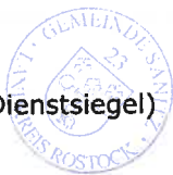
Enrico Bendlin Bürgermeister

Anlage: Übersichtskarte mit Darstellung des Geltungsbereiches